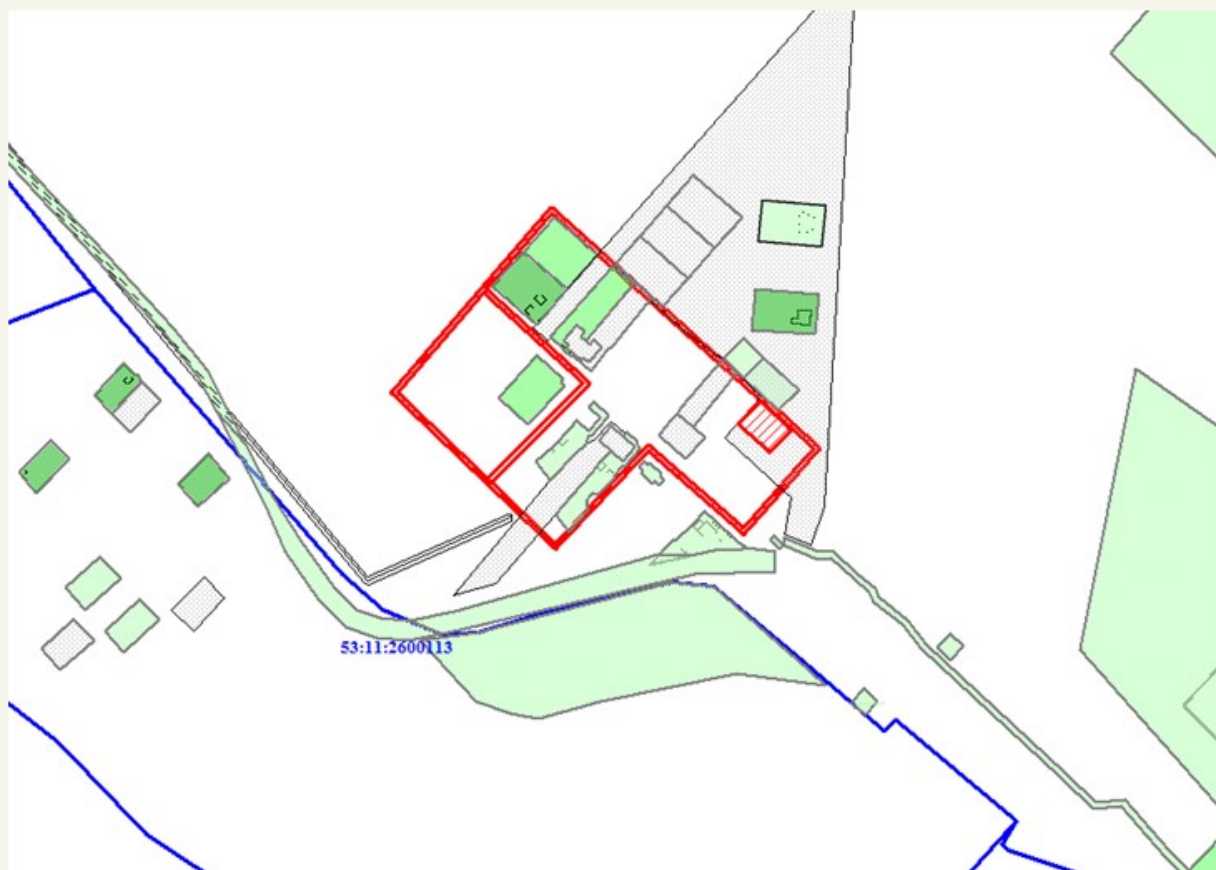
Схема расположения земельного участка